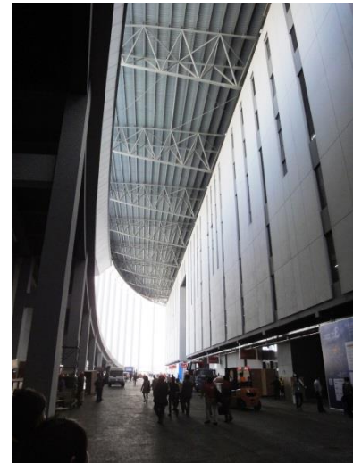
エントランス・ホール