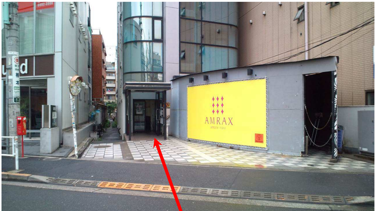
オフィスビル入口