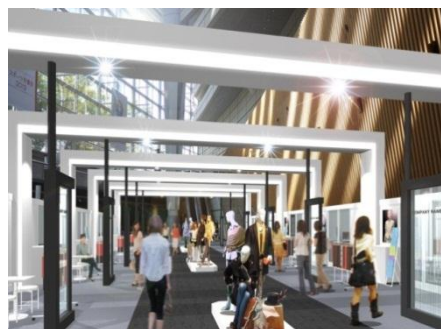
↑ Factory zoon/Textile zoon ↓